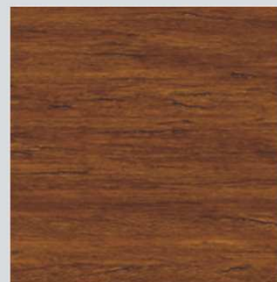
FINITURA EFFETTO CERA