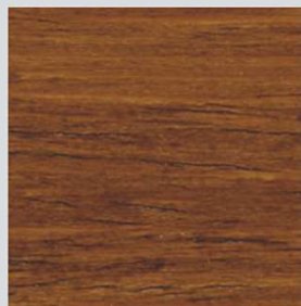
IMPREGNANTE A CERA