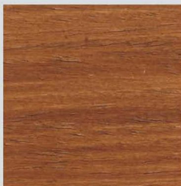
NOCE CHIARO CLASSICO