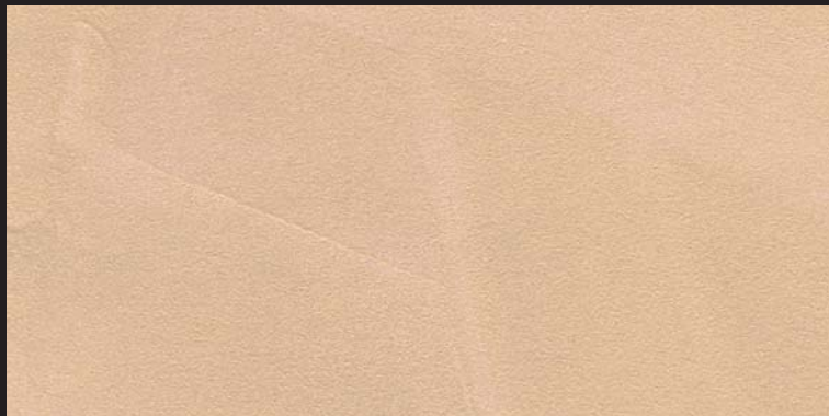
L14 - Oro Malva - 50 ml T29