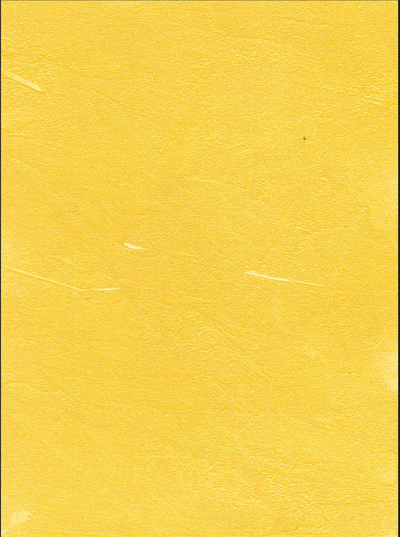
L01 - Oro Giallo (Yellow Gold)

Tutte le tinte sono da considerarsi puramente indicative - All the tints are to be considered as approximate