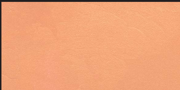
L15 - Oro Rosso - 50 ml T28