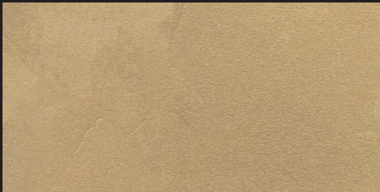
L13 - Oro Antico - 15 ml T24