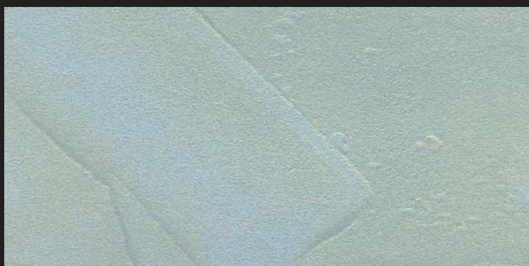
L17 - Oro Azzurro - 50 ml T30