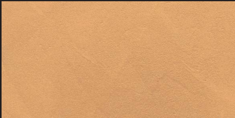
L12 - Oro Rame - 100 ml T22