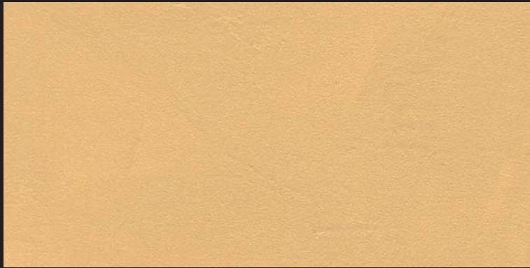
L11 - Oro Bronzo - 100 ml T23