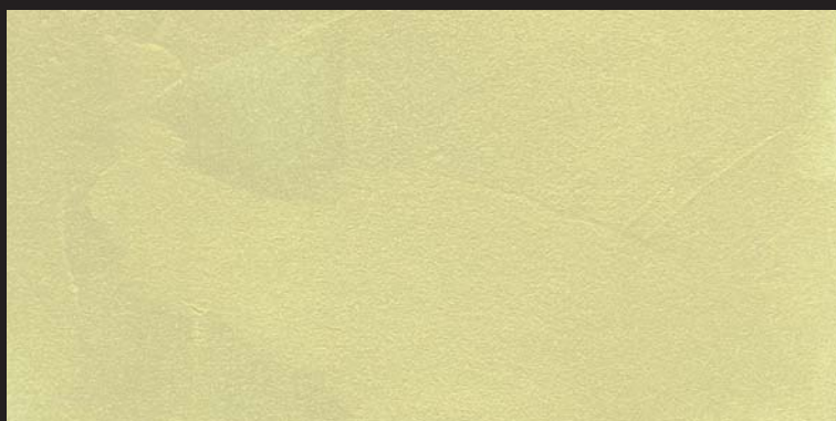
L16 - Oro Verde - 50 ml T31