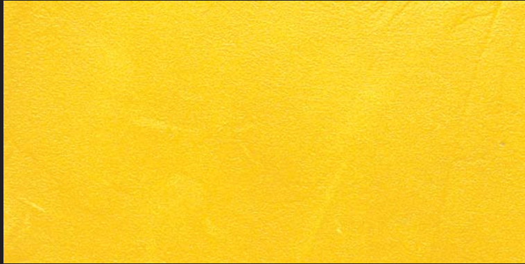
L10 - Oro Zecchino - 50 ml T34